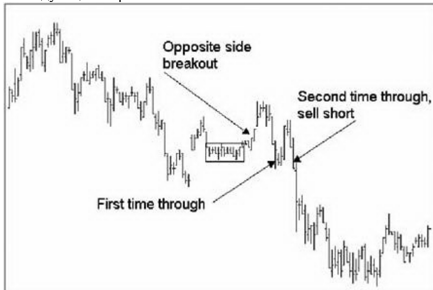
Прорывы зоны консолидации против и по направлению тренда

Торговля выглядела бы следующим образом: